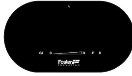
TOUCH CONTROL 3 FOYERS RONDS NOIR I368 N30