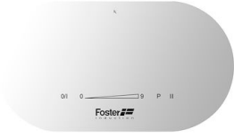
TOUCH CONTROL 3 FOYERS RONDS BLANC I368 B35